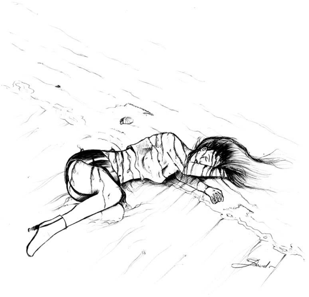
Ilustración: David Simarro Martínez